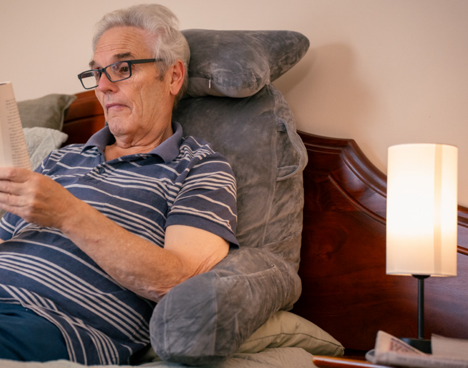
Lampada "touch" da tavolo a controllo tattile e cuscino lombare per la schiena / Glow touch table lamp and backrest pillow