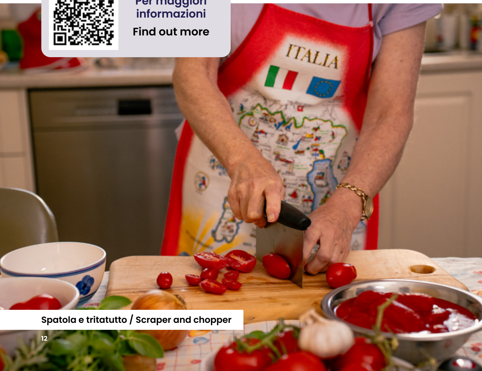
Spatola e tritatutto / Scraper and chopper